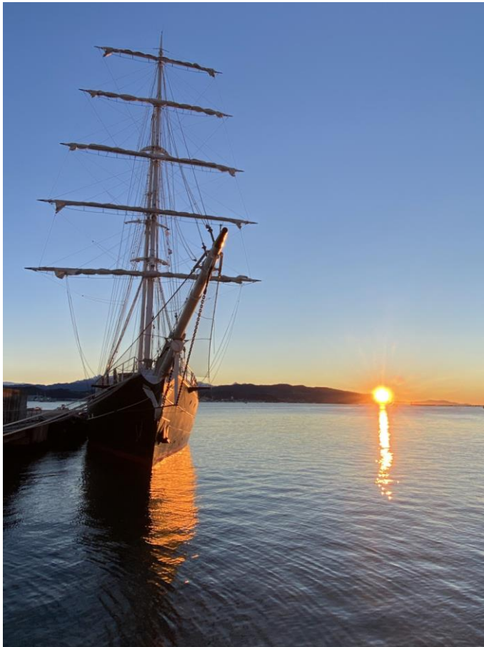
Sorge il sole su Nave Italia

«Nato ad Asti il 13 aprile 1964. Abito a La Spezia, per lavoro, dal 1985, ma sono di origini piemontesi ed esattamente di Canelli (AT). Da alcuni anni mi dedico agli scatti fotografici di paesaggi marini (e non solo) usando un Iphone 12 Pro Max. Una bella soddisfazione premiata da innumerevoli complimenti nei vari gruppi fotografici social a cui sono iscritto».