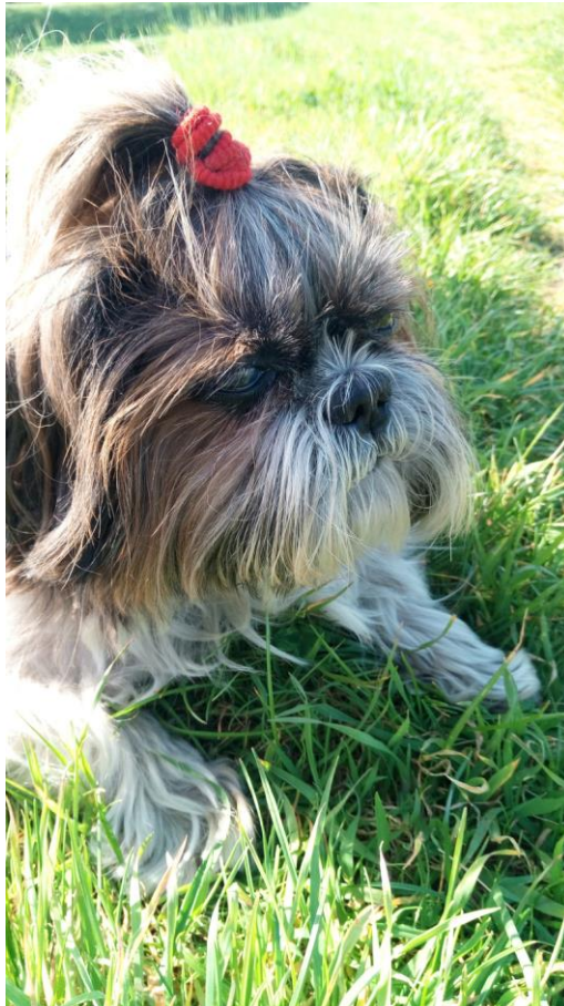
Il mio Toby