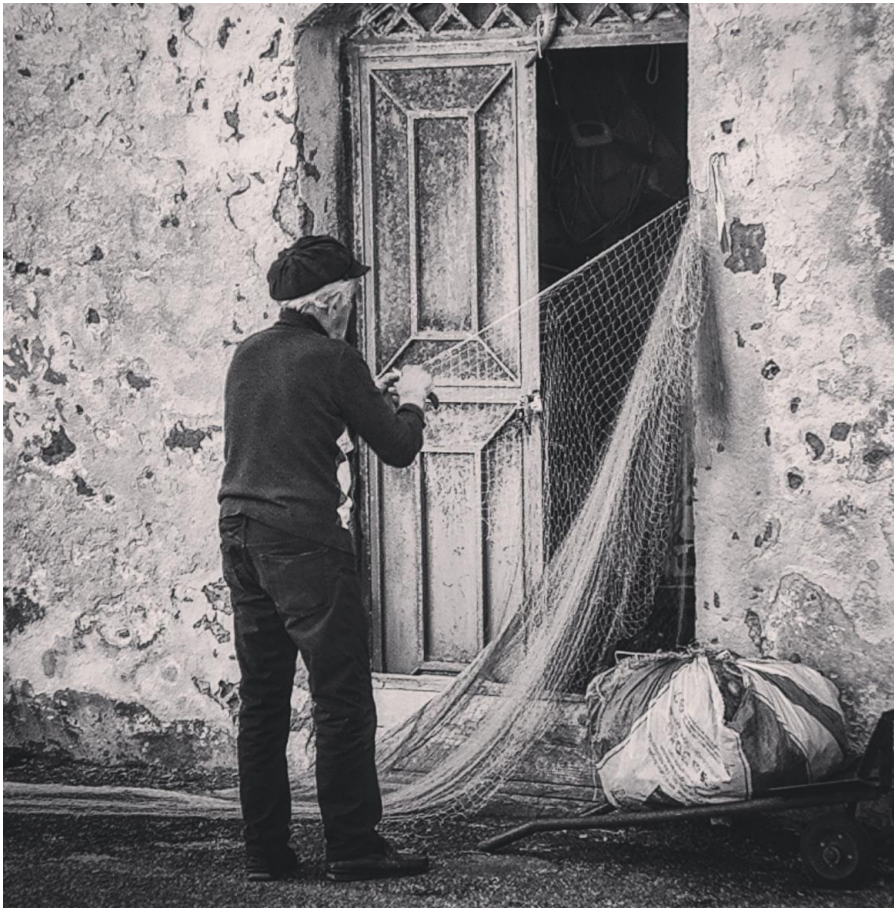
Il sacrificio di un uomo Canon 1200

«Nato a Napoli l'11 settembre 1987. Cresciuto nel centro storico tra i vicoli di Napoli, ho una forte passione per la fotografia che con gli anni è andata crescendo. Con le mie foto cerco di esprimere quello che provo dentro di me e cerco di far vivere il posto in cui mi trovo o almeno ci provo».