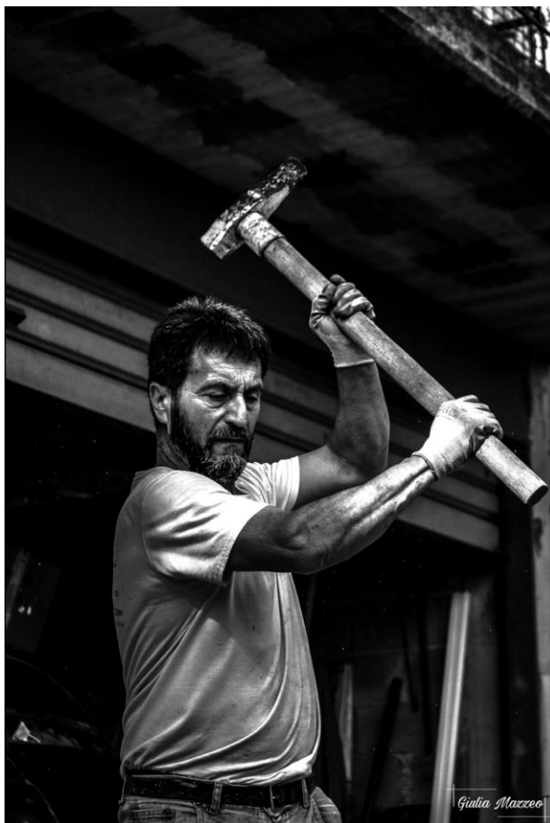
Umiltà e dignità – A mio padre

«L'essere nata nel periodo di transizione tra gli anni '90 e il 2000 mi ha dato la possibilità di entrare a contatto con vecchio e nuovo approccio alla fotografia. Passione questa nata grazie all'influenza di mio padre, da sempre incuriosito dalla fotografia e in grado di creare effetti particolari con mezzi poveri. I miei studi universitari relativi alla storia dell'arte hanno fatto crescere in me spunti e sfide utili alla realizzazione di molti dei miei lavori, come nel caso di Caravaggio e dell'importanza che egli dava alla luce. Il mio è un approccio semplice alla fotografia, in quanto ho improntato tutto il mio percorso da autodidatta sui precetti della Straight Photography».