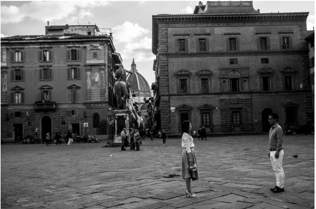
Sguardo su Firenze

«Sono nata a Modena. Sono anni che mi dedico alla fotografia, nonostante io abbia preso un percorso di studi differente. Con la fotografia cerco di immortalare i piccoli momenti della vita quotidiana e di abbattere i limiti che non mi permettono di esprimermi nel migliore dei modi. Prediligo la street photography ma, in generale, non mi faccio sfuggire la possibilità di immortalare la vita intorno a me».