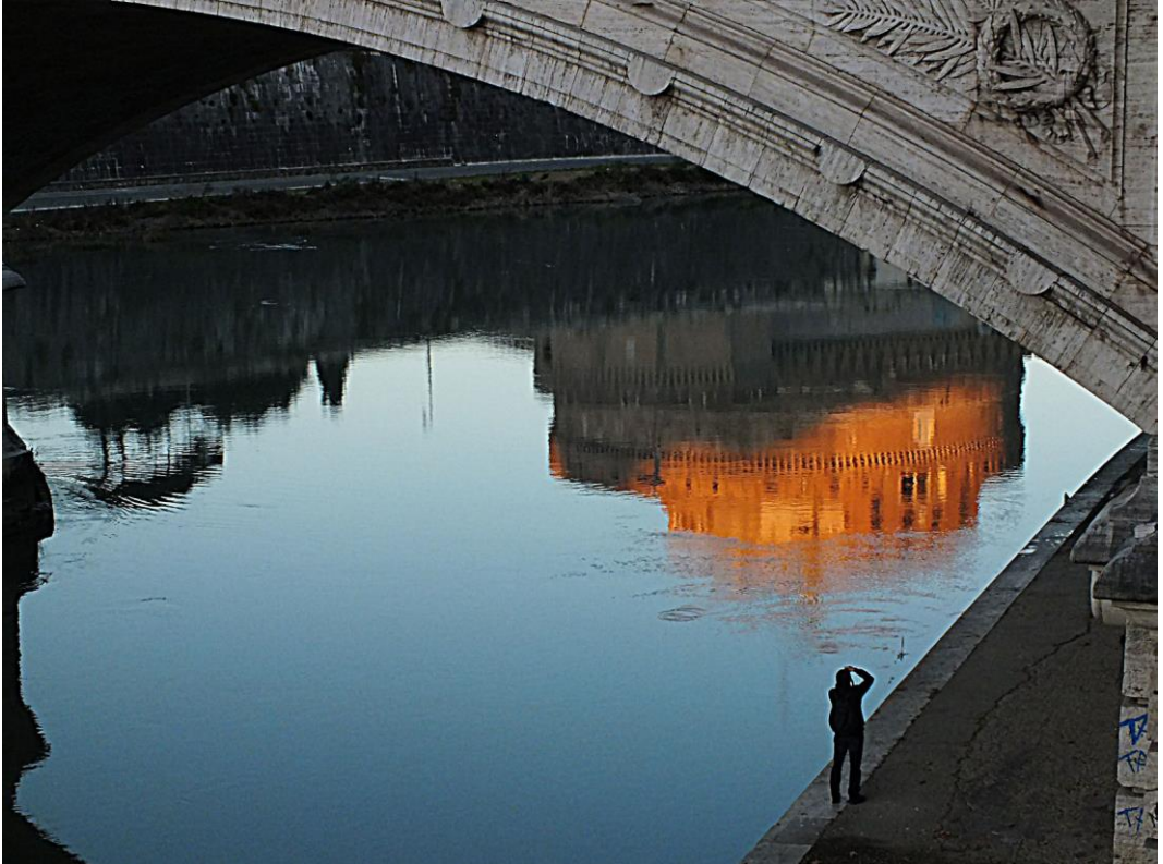
Riflessi sul fiume Fujifilm finepix

«Sono nato a Roma il 29 dicembre del 1995. Sono fotografo per diploma e per passione: per diploma perché ho frequentato l'Istituto per la fotografia Roberto Rossellini, per passione perché dopo la scuola ho cominciato a scattare foto in giro per Roma e dintorni e ho capito che la fotografia per me è un modo di esprimere la mia creatività».