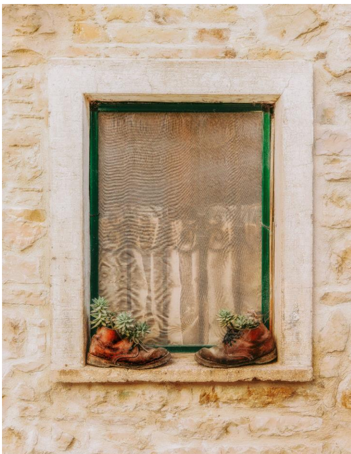
Le scarpe di Charlie Chaplin

Si accosta alla fotografia in età matura, attratto dalla capacità dell'obiettivo di raccontare storie vere. Realista e al contempo poetico, non usa filtri, se non quello dell'emozione. È così che il passo stanco di un'anziana donna, catturato dal suo scatto, esprime il racconto di una vita, e la luce di un lampione, colta nell'attimo di magia, rende eterna una piazza dimenticata. Egidio è gioia e malinconia. È dualismo vivo che, scatto dopo scatto, ci apre alla sorpresa.