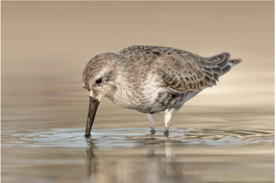
Piovanello pancia nera in alimentazione sulle coste Siciliane durante il periodo migratorio post riproduttivo

«Nato a Catania nel 1975. La fotografia ha sempre fatto parte della mia vita, ho iniziato all'età di 12-13 anni in un corso pomeridiano alle scuole medie primarie, con scatto e sviluppo in B/N. Negli ultimi anni mi sono buttato a capofitto nella fotografia naturalistica, in particolare avifauna presente nella mia terra, la Sicilia. Il mio motto è: Fare foto è una forma di libertà, nell'espressione del proprio punto di vista con un semplice "Click" in assenza di parole...»