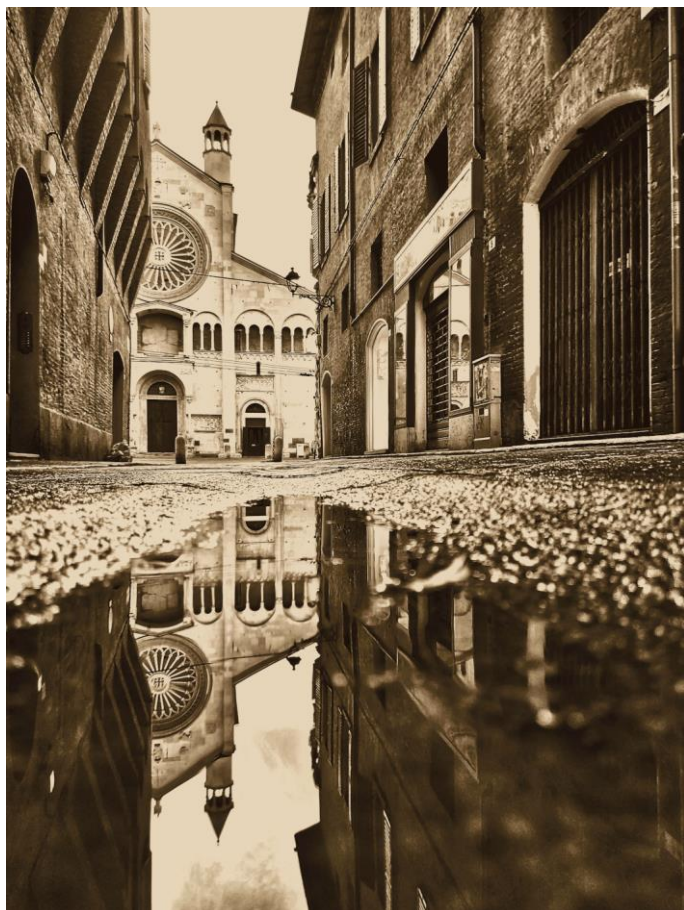
Duomo di Modena

«Modenese. Vengo da una formazione classica con studi umanistici. Nel tempo mi sono sempre più specializzata nell'ambito della comunicazione e organizzazione di iniziative/sponsorizzazioni a carattere sportivo, istituzionale e culturale per un importante gruppo bancario nazionale. Vegetariana, amante di musica, arte e viaggi, negli ultimi anni ho maturato una grande passione per la fotografia. Faccio parte della community Instagram "Clickfor_Italia" che ha l'obiettivo di valorizzare il nostro bellissimo territorio attraverso gli scatti più suggestivi».